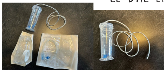
DAL avec matériel stérile de type hospitalier (bouteille).

Cette pratique n'est plus recommandée en raison des risques d'étouffement. En ce sens, l'utilisation du DAL s'effectue avec une bouteille ou un récipient dans lequel la tubulure est déposée. Seulement la succion du bébé servira à faire monter le lait dans la tubulure, sans pression externe qui ajouterait un débit au DAL.